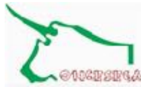
Organismo Nacional de Certificación y Servicios Ganaderos